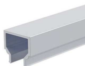
Difusor Opalino (Ref.: DFD4055)