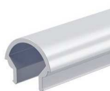
Difusor Opalino (Ref.: DFD4555)